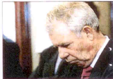
José Ramón Álvarez Rendueles fue Gobernador del Banco España.