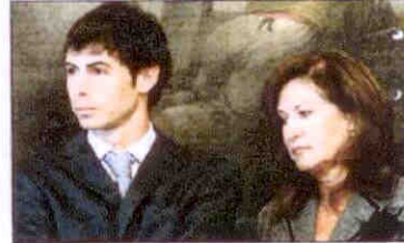
Uno de sus tres hijos y su mujer acompañaron al homenajeado.