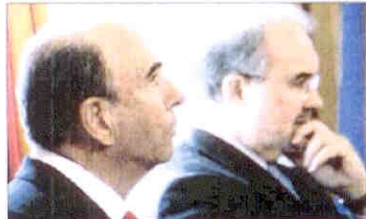
Emilio Botín no da puntada sin hilo, si está es por algo.